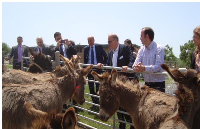
L'Ambasciatore italiano Brasioli e il sindaco Hansa in visita a Footprints of Joy.

Il 2013 è stato anche l'anno del consolidamento di STD con cambiamenti significativi nella gestione operativa e amministrativa dell'associazione grazie a controlli finanziari più rigidi , ad un sistema di reportistica più efficiente (tra i vari centri, la Direzione STD e il Consiglio Direttivo) e grazie all'utilizzo di nuovi strumenti quali il bilanciamento e i piani finanziari annuali e mensili dettagliati. Sono stati introdotti questionari di valutazione con i nostri interlocutori maggiori (tutti positivi), si è rafforzata la raccolta fondi locale e si è migliorata ulteriormente la fruibilità del rifugio Footprints of Joy attraverso la costruzione dei bagni, di una nuova stalla per cavalli, di una più ampia area di socializzazione per cani e di nuovi ripari per gli asini. Inoltre si è creato all'interno della proprietà un sistema di prevenzione degli incendi e si è installata una nuova segnaletica all'interno del parco. Dopo un anno dalla nascita Footprints of Joy è così diventato un centro riconosciuto all'avanguardia a livello nazionale ed europeo con reportage nelle tv nazionali in Italia (RAI), Germania (RTL) e Romania (Realitatea TV) e visite importanti che si sono susseguite nel 2013. Oggi FOJ rimane aperto al pubblico tutti i giorni dalle 10 alle 17.